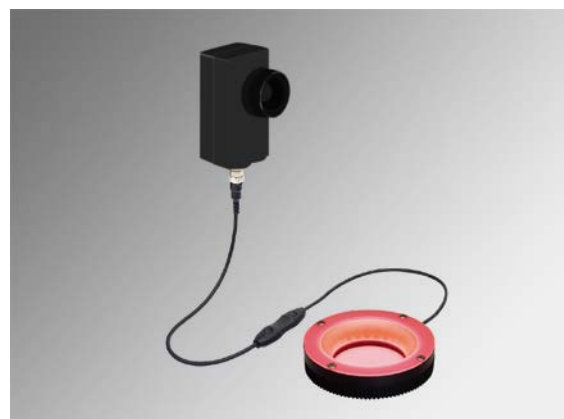
製品接続イメージ写真