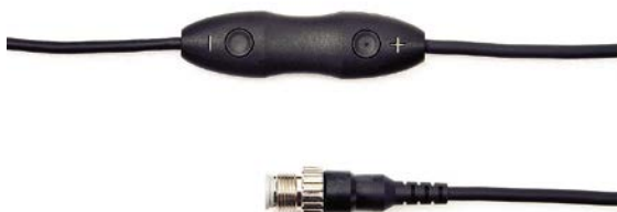
ユニット・コネクタ部分

また、シーシーエスでは今後、さらなる製品ラインナップの拡充を進めていく予定であり、画像処理システムなどの周辺機器との接続性が高い製品の開発によって、お客様のニーズに対応してまいります。