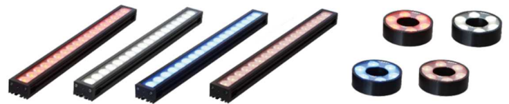
バータイプ HLDL3 シリーズ

当社が 2012 年に発売したバー照明 HLDL2 シリーズは、自動車部品など大型ワークの外観検査や、検査対象物から離れた位置に照明を設置する検査環境や、製造現場の自動化に対応するロボットピッキングなど、広範囲を