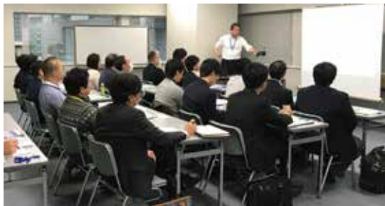
※写真は2019年開催時のものです。