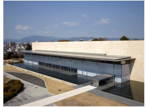
京都国立博物館 平成知新館