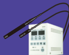
(スポット照射タイプ)